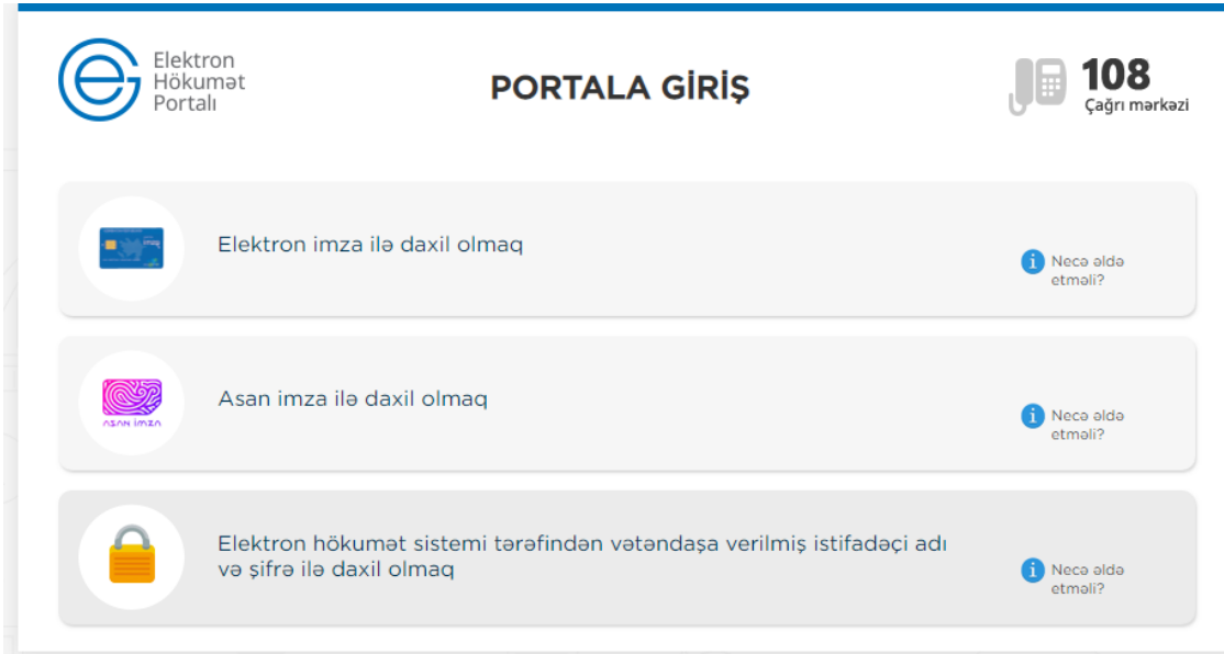
Şəkil 1. Sistemə giriş

1.1. “Əmək müqaviləsi bildirişləri barədə məlumatların işçilər tərəfindən əldə edilməsi” elektron xidmətindən istifadə etmək üçün https://www.e-gov.az/ internet ünvanına daxil olaraq “Portala giriş” düyməsini tıklamaq lazımdır. Daha sonra aşağıdakı şəkildə əks olunmuş autentifikasiya vasitələrindən istifadə etməklə sistemə daxil olmaq mümkündür.