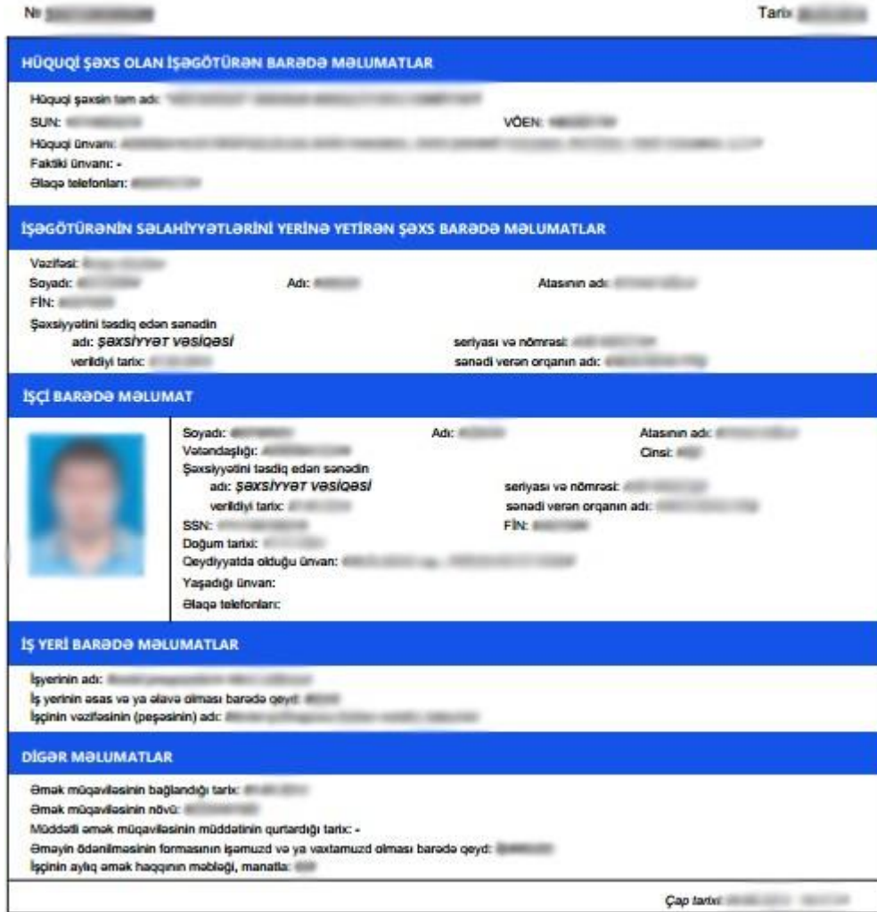
Şəkil 8. Əmək müqaviləsinin bağlanması ilə bağlı əmək müqaviləsi bildirişi